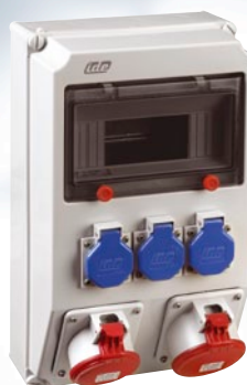
Cajas con tomas de corriente montadas y cableadas