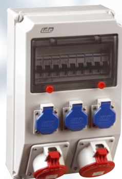
Cajas con tomas de corriente y protecciones montadas y cableadas